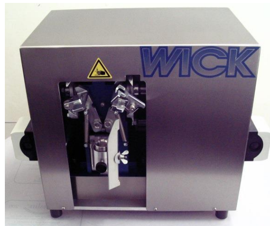
SD1m, electrically driven SD1m, elektrischer Antrieb